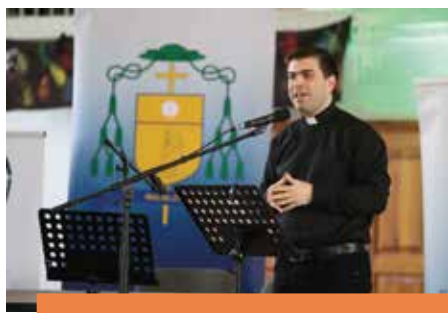
EGYHÁZMEGYEI IFJÚSÁGI NAP Zenekarok részvételével 10-15. o.