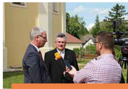
MEGÚJULT A KARÁDI TEMPLOM Államtitkárral zajlott a szentelés 14-15. o.