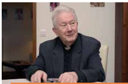
CSAK FELFELÉ HALADHATUNK Találkozás Beton atyával 6-7. o