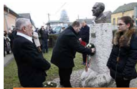
A BALLAGÓ IDŐ NYOMÁBAN Fekete István emlékezete 10-11.o