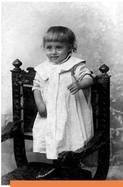
Másfél évesen a göllei szülőházban

A háznagy ezzel zárta felszólalását: – „Nézem a sötétséget, de látom a csillagokat”, ezt Fekete István írta, ő hagyta ránk e gondolatot, s a XXI. század kíméletlen szellemi harc között élő, fogyasztásra berendezkedett, komfortzónájából nehezen kimozduló emberét arra biztatja: