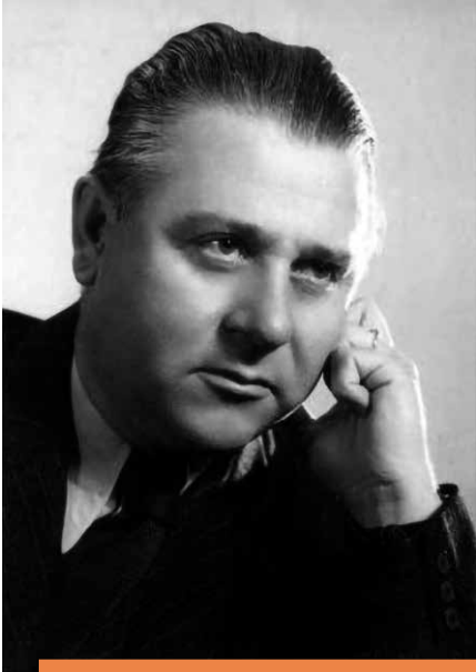
A természet szerelmese maradt örökre