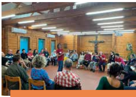
CSALÁDOS HÉTVEGE SZENTBENEDEKEN A Plébániai Unió szervezte 6. o.