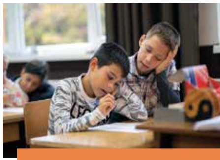
HIT, REMÉNY, SZERETET Hittanverseny Lábodon 8-9. o.