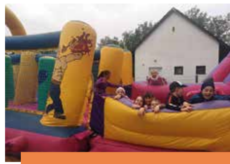
JÁTÉK ÉS JÓTÉKONYSÁGI SÜTIVÁSÁR Családi nap Torvajon 25. o.