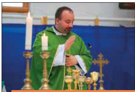
SZEMESI IFJÚSÁGI TALÁLKOZÓ 21. alkalommal rendezték meg 6-7.o.

Kovács Tibor fotójával kívánunk lapunk valamennyi olvasójának áldott, kegyelmekben gazdag húsvéti ünnepeket!