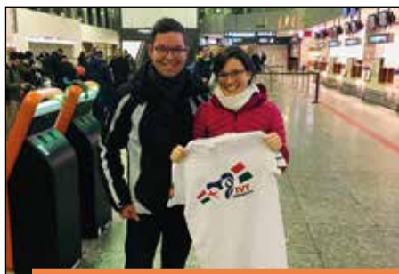
PANAMÁRA FIGYELT A VILÁG Kettős élménybeszámoló 13-15. o.