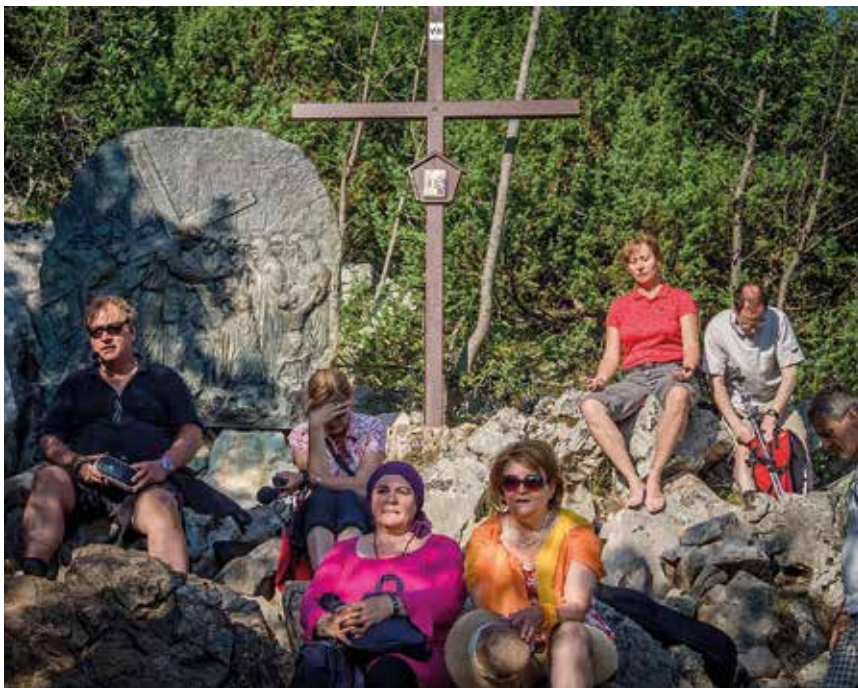
VIII. állomás: Jézus találkozik a síró jeruzsálemi asszonyokkal